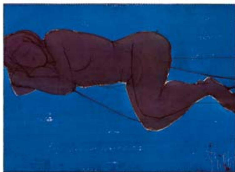
En enero, Eva comenzará a despertar